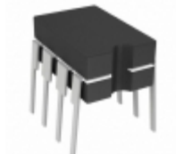
TC4627MJA Microchip Technology IC CMOS DRVR W/BOOST 1.5A 8-CDIP