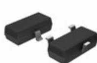
11LC010T-E/TT Microchip Technology IC EEPROM 1KBIT 100KHZ SOT23-3