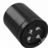
ECE-T2EA182FA Panasonic Electronic Components CAP ALUM 1800UF 20% 250V SNAP