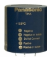
ECE-T2EA122EA Panasonic Electronic Components CAP ALUM 1200UF 20% 250V SNAP