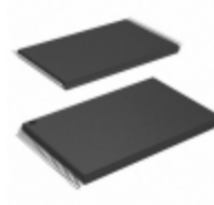
AS6C6416-55TIN Alliance Memory, Inc. IC SRAM 64M PARALLEL 48TSOP I