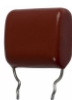
ECQ-P1H334GZW Panasonic Electronic Components CAP FILM 0.33UF 2% 50VDC RADIAL