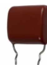
ECQ-P1H334FZW Panasonic Electronic Components CAP FILM 0.33UF 1% 50VDC RADIAL