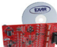
SP336EEY-0A-EB Exar Corporation EVAL BOARD FOR SP336EEY