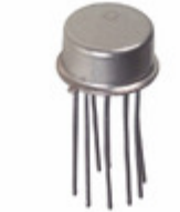
AD536ASH Analog Devices Inc. IC TRUE RMS/DC CONV TO-100-10