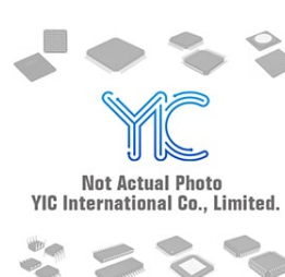
MIC29301-1.8WU MICREL MICREL TO-263