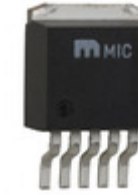
MIC29301-12BU Microchip Technology IC REG LDO 12V 3A TO263-5