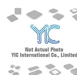
MIC29300-5WT MICREL MICREL TO-220