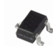
ADM810SAKS-REEL7 Analog Devices Inc. IC SUPERVISOR P/P 2.93V SC70-3