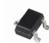
ADM810SAKSZ-REEL Analog Devices Inc. IC SUPERVISOR MPU 2.93V SC-70-3