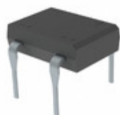
DBL208GHC1G TSC (Taiwan Semiconductor) BRIDGE RECT 1PHASE 1.2KV 2A DBL