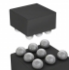
SST25WF080-75-4I-ZAE Microchip Technology IC FLASH 8MBIT 75MHZ 8CSP