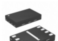
SST25WF080BT-40I/NP Microchip Technology IC FLASH 8MBIT 40MHZ 8USON