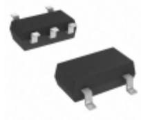
DMA202010R Panasonic Electronic Components TRANS 2PNP 50V 0.1A MINI5