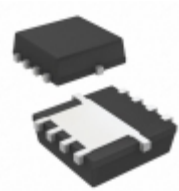
SI7425DN-T1-GE3 Vishay Siliconix MOSFET P-CH 12V 8.3A PPAK 1212-8