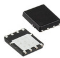
SI7430DP-T1-GE3 Electro-Films (EFI) / Vishay MOSFET N-CH 150V 26A PPAK SO-8