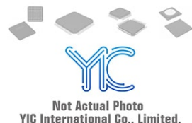
AT97SC3204S-X1ABO ATMEL ATMEL SSOP