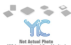
AT97SC3204T TSSOP AT97SC3204T TSSOP