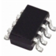
ADG3242BRJZ-REEL7 Analog Devices Inc. IC SW BUS CTRL 2.5/3.3V SOT23-8