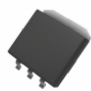
MIC37300-1.5BR Microchip Technology IC REG LDO 1.5V 3A SPAK-3