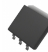
MIC37300-1.5BR TR Microchip Technology IC REG LDO 1.5V 3A SPAK-3