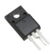
FQPF9N25CYDTU AMI Semiconductor / ON Semiconductor MOSFET N-CH 250V 8.8A TO-220F