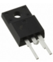
FQPF9N25CYDTU Fairchild/ON Semiconductor MOSFET N-CH 250V 8.8A TO-220F