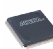
EPM7256BQC208-5 Altera IC CPLD 256MC 5NS 208QFP