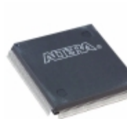
EPM7256BQC208-10 Altera IC CPLD 256MC 10NS 208QFP