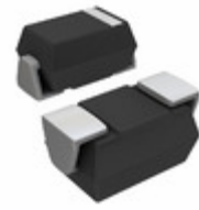
US2JA-TP Micro Commercial Co DIODE ULTRA FAST 2A 600V SMA