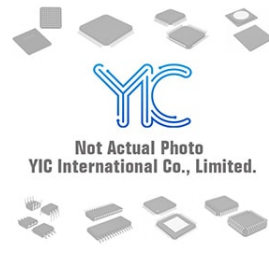
US2K FAIRCHI FAIRCHI DO-214A