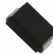
US2KA Fairchild/ON Semiconductor DIODE GP 800V 1.5A DO214AC