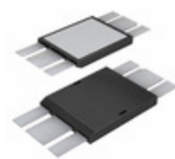
IXFZ140N25T IXYS MOSFET N-CH 250V 100A DE475