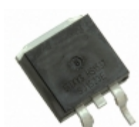
IXFY4N85X IXYS MOSFET N-CH 850V 3.5A TO252-3