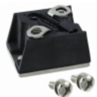
VS-T70HFL100S05 Electro-Films (EFI) / Vishay DIODE GEN PURP 1KV 70A D-55