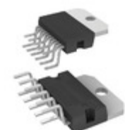
TDA7396 STMicroelectronics IC AMP AUDIO PWR 65W MULTIWATT11