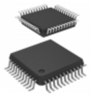
TDA7402 STMicroelectronics IC PROCESSOR CAR SIGNAL 44- LQFP