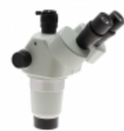
SPZHT-135 Aven MICRO STEREO ZM 21X-135X NON-ILL