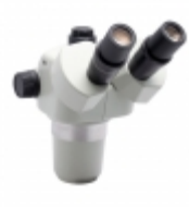
SPZT-50 Aven MICRO STEREO ZM 6.7X-50X W/LIGHT