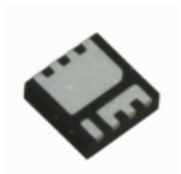
IRFH7921TRPBF International Rectifier (Infineon Technologies) MOSFET N-CH 30V 15A PQFN56