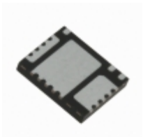
IRFH7911TRPBF International Rectifier (Infineon Technologies) MOSFET 2N-CH 30V 13A/28A PQFN