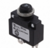
CMB-073-11C1N-B-A/07 Carling Technologies CIR BRKR THRM 7A 250VAC 32VDC