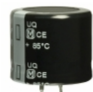
EET-UQ2E681DF Panasonic Electronic Components CAP ALUM 680UF 20% 250V SNAP