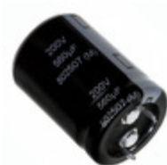
EET-UQ2E681BA Panasonic Electronic Components CAP ALUM 680UF 20% 250V SNAP