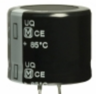
EET-UQ2E561DA Panasonic Electronic Components CAP ALUM 560UF 20% 250V SNAP