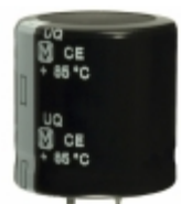
EET-UQ2E681DA Panasonic Electronic Components CAP ALUM 680UF 20% 250V SNAP