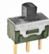
MS13ANA03 NKK Switches SWITCH SLIDE SPDT 6A 125V