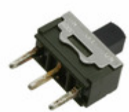
MS13ANW03 NKK Switches SWITCH SLIDE SPDT 6A 125V