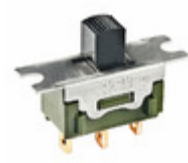
MS13AFG01 NKK Switches SWITCH SLIDE SPDT 0.4VA 28V