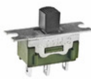
MS13AFW01 NKK Switches SWITCH SLIDE SPDT 6A 125V