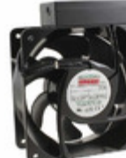
UF16FC23-BTHR Mechatronics FAN AXIAL 160X62MM 230VAC TERM