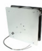
UF160DPB12-H1S2A Mechatronics BLOWER 220X56MM 115VAC