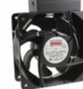
UF16FC12-BTHR Mechatronics FAN AXIAL 160X62MM 115VAC