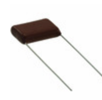
ECQ-E2684KFW Panasonic Electronic Components CAP FILM 0.68UF 10% 250VDC RAD