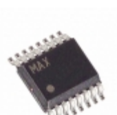
MAX5133BEEE Maxim Integrated IC DAC SERIAL 13BIT F-S 16-QSOP