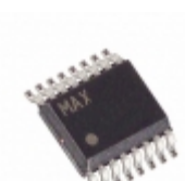
MAX5133AEEE+T Maxim Integrated IC DAC 13BIT 3V LP SER 16-QSOP