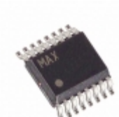
MAX5133AEEE+ Maxim Integrated IC DAC 13BIT 3V LP SER 16-QSOP