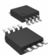
TC1300Y-2.7VUATR Microchip Technology IC REG LDO 2.7V 0.3A 8MSOP