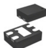
MIC94310-GYMT-T5 Microchip Technology IC REG LDO 1.8V 0.2A 4TMLF