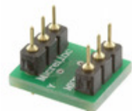
MIC94310-GYMT-EV Micrel / Microchip Technology BOARD EVAL FOR MIC94310-GYMT