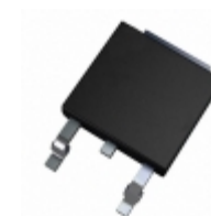
AN7708SP-E1 Panasonic Electronic Components IC REG LDO 8V 1.2A SP3SUA