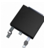
AN7706SP Panasonic Electronic Components IC REG LDO 6V 1.2A SP3SUA