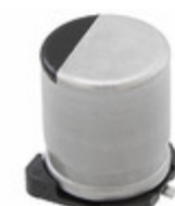
EEE-FT1A102AP Panasonic Electronic Components CAP ALUM 1000UF 20% 10V SMD