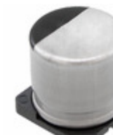
EEE-FT1C102GP Panasonic Electronic Components CAP ALUM 1000UF 20% 16V SMD