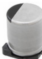
EEE-FT1A102GP Panasonic Electronic Components CAP ALUM 1000UF 20% 10V SMD