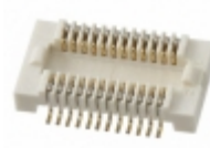
AXK5F10537YG Panasonic CONN SOCKET BRD/BRD .5MM 10POS