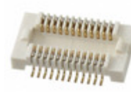
AXK5F10537YG PanaVise CONN SOCKET BRD/BRD .5MM 10POS