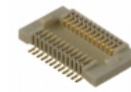
AXK5F10347YG Panasonic CONN SKT BRD TO BRD .5MM 10POS