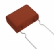
ECW-F2684RJA Panasonic Electronic Components CAP FILM 0.68UF 5% 250VDC RADIAL