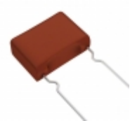
ECW-F2684JAB Panasonic Electronic Components CAP FILM 0.68UF 5% 250VDC RADIAL