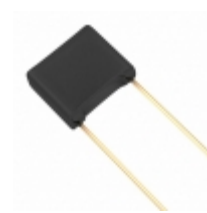
ECW-F2565JA Panasonic Electronic Components CAP FILM 5.6UF 5% 250VDC RADIAL