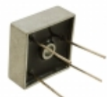
MB256W Micro Commercial Co RECT BRIDGE 25A 600V WIRE LEADS