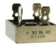
MB254-F Diodes Incorporated RECTIFIER BRIDGE 25A 400V MB