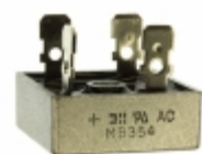
MB256 Diodes Incorporated RECTIFIER BRIDGE 600V 25A MB