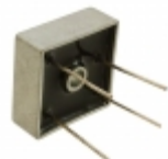
MB252W-BP Micro Commercial Co RECT BRIDGE 25A 200V WIRE LEADS