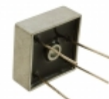
MB256W-BP Micro Commercial Co RECT BRIDGE 25A 600V WIRE LEADS