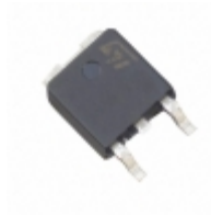
STTH602CBY-TR STMicroelectronics DIODE ARRAY GP 200V 3A DPAK