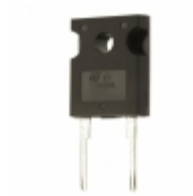
STTH60L04W STMicroelectronics DIODE GEN PURP 400V 60A DO247