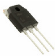
STTH60AC06CP STMicroelectronics DIODE ARRAY GP 600V 30A TO3P