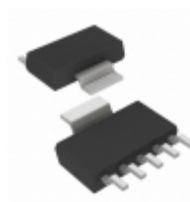
MCP1791T-3002E/DC Microchip Technology IC REG LDO 3V 70MA SOT223-5