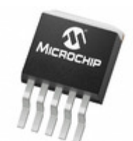
MCP1791T-3302E/ET Microchip Technology IC REG LDO 3.3V 70MA DDPAK