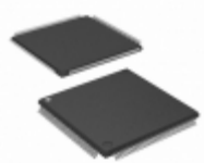
AT40K05AL-1BQC Microchip Technology IC FPGA 5K GATES 144LQFP