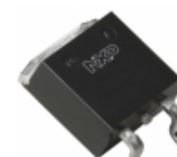
PSMN2R8-40BS,118 Nexperia USA Inc. MOSFET N-CH 40V 100A D2PAK