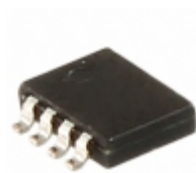
PSMN2R9-30MLC,115 Nexperia USA Inc. MOSFET N-CH 30V 70A LFPAK33