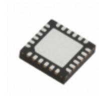
RFSA2624TR7 RFMD ATTENUATOR DGTL 6BIT 24-MCM