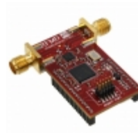
RFSM6525EM357-410 RFMD RF EVAL BOARD FOR RF6525