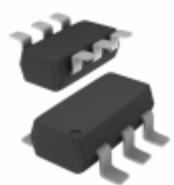
MMBT2132T3G ON Semiconductor TRANS NPN 30V 0.7A SC74-6