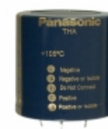
ECE-T1HA153EA Panasonic Electronic Components CAP ALUM 15000UF 20% 50V SNAP