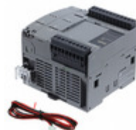
FC6A-C16K1CE IDEC 16IO CPU 24VDC TRANS. SINK