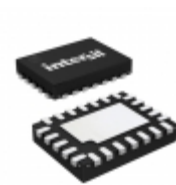
ISL58113CRZ-T13 Intersil IC LASER DVR 200MHZ 3.3V 24QFN