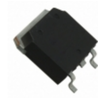
IXFT42N50P2 IXYS MOSFET N-CH 500V 42A TO268