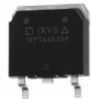
IXFT44N50P IXYS MOSFET N-CH 500V 44A TO-268 D3