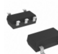
S-80124ANMC-JCJT2U SII Semiconductor Corporation IC VOLT DETECTOR 2.4V SOT23-5