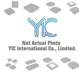
KA3882 SANSUNG KA3882 SANSUNG