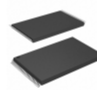
SST38VF6402-90-5I-EKE Microchip Technology IC FLASH 64MBIT 90NS 48TSOP