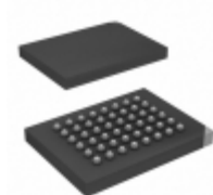
SST38VF6402-90-5C-B3KE Microchip Technology IC FLASH 64MBIT 90NS 48TFBGA